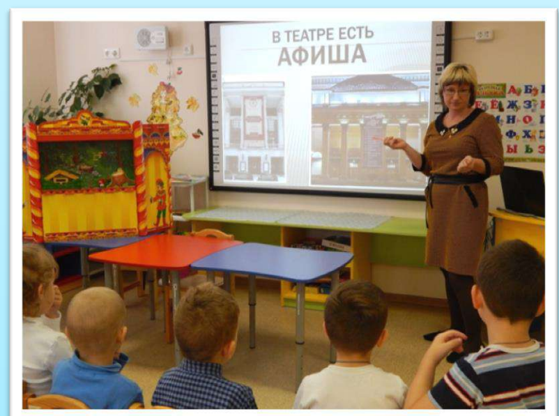
При знакомстве с театром.