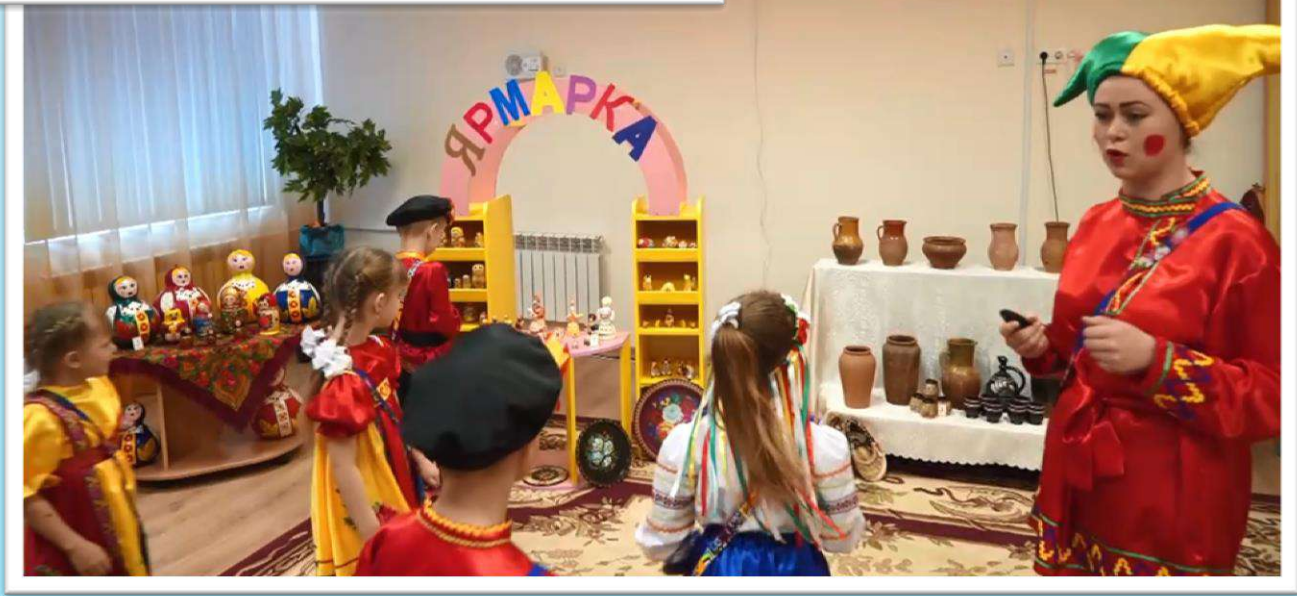
Образовательная деятельность «Ярмарка народных умельцев» в музыкальном зале.