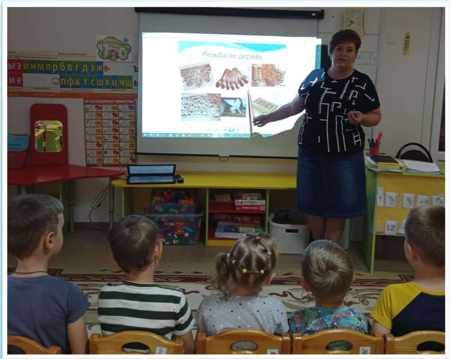
Ознакомление с народными промыслами.